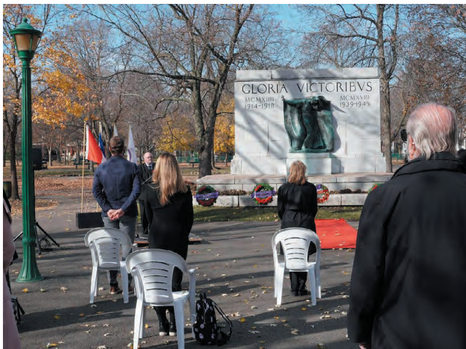
Un moment de silence était observé par tous en hommage aux soldats tombés au combat lors de la célébration du 9 novembre dernier au Parc Outremont.