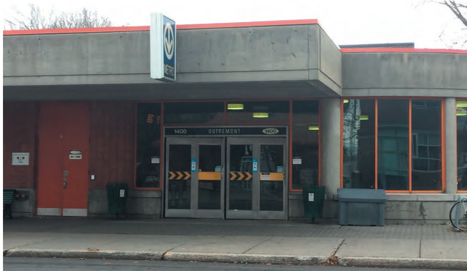
La station Outremont avant le début des travaux

Cette phase débutant en fin novembre d'une durée de 9 jours consiste principalement à la déviation de la conduite d'égout afin d'intégrer un des ascenseurs. Pendant les travaux de cette phase, l'avenue Van Horne sera complètement fermée à la circulation ainsi que l'avenue Wiseman. Les détours se feront via la rue Ducharme et l'avenue Lajoie. De plus, la fermeture de l'intersection entraînera un double sens sur la rue Wiseman au sud de la rue