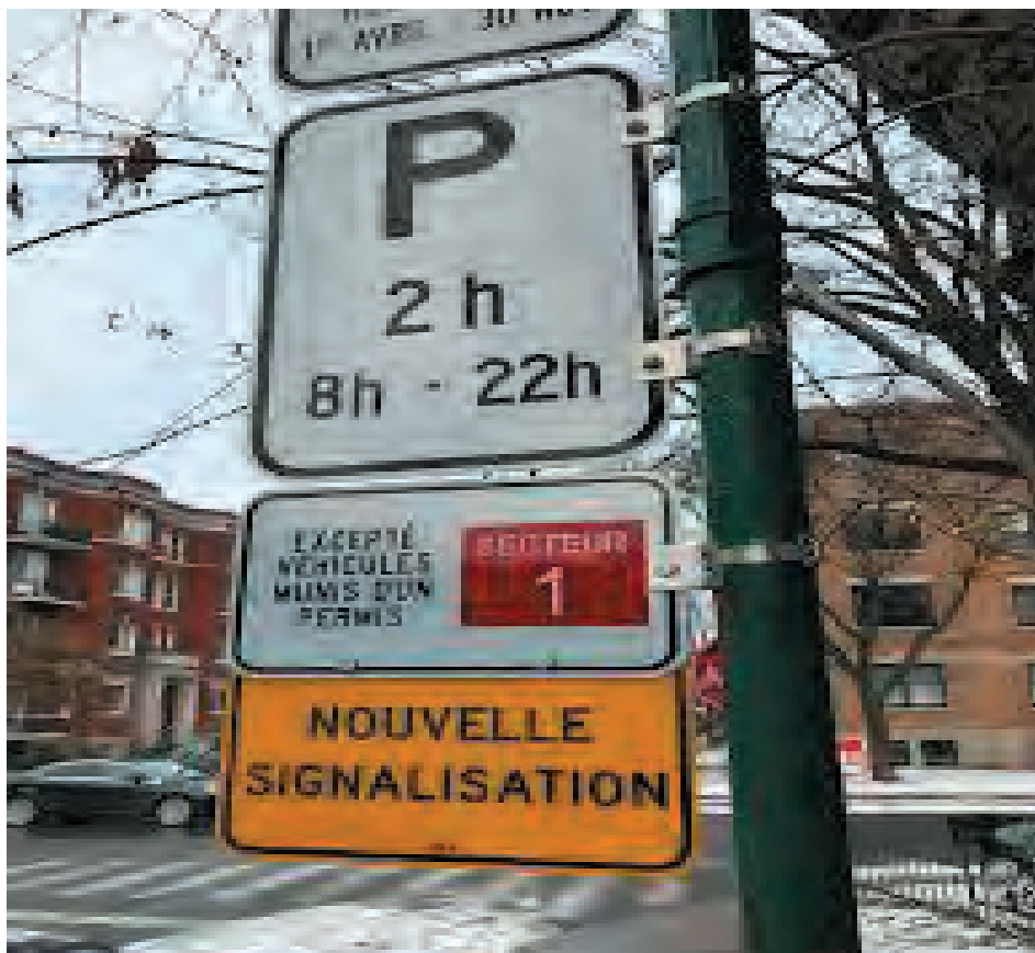
Un panneau de stationnement dans Outremont

Plusieurs citoyens, insatisfaits des réponses qui leur avaient été faites, ont relancé les élus à propos d'enjeux qui les touchaient. La question sur le tarif de gestion des matières résiduelles a été ramenée sur le tapis. En effet, en privilégiant une