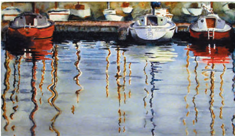
« Marina », aquarelle sur papier