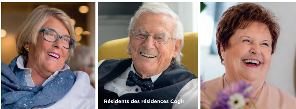
Résidents des résidences Cogir

APPRÉCIEZ L'HIVER, ENTOURÉ DE GENS QUI VOUS RESSEMBLENT