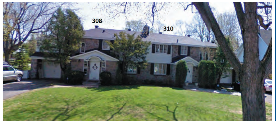
308 ET 310, CROISSANT GENEVA / 308 AND 310 GENEVA CRESCENT

As required by By-law No. 1435 Governing the Demolition of Immovable, the Demolition Review Committee of the Town of Mount Royal will hold a closed session meeting on Friday, February 26, 2021. The recording of this meeting will be available on the Town's website as of Monday, March 1.