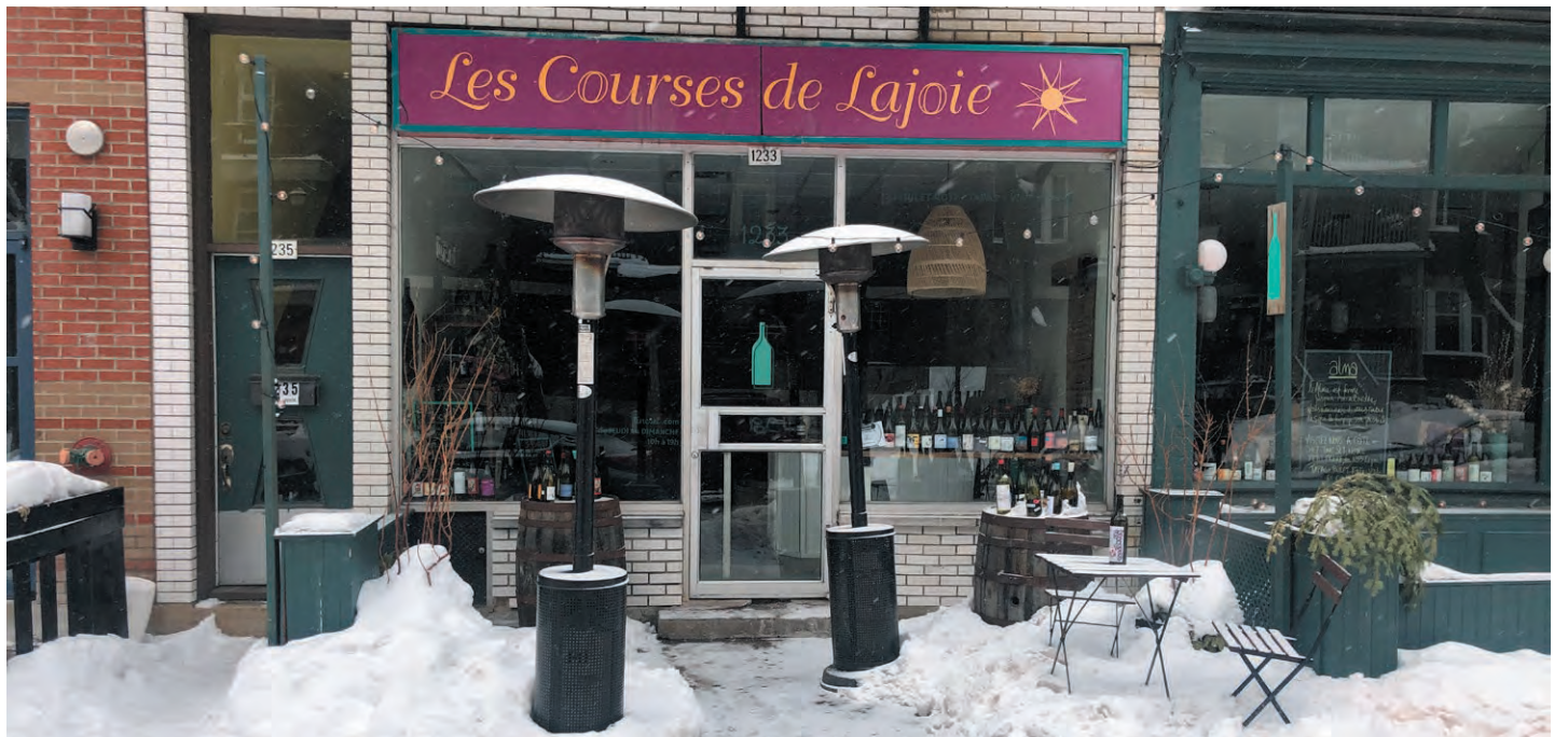
Le restaurant Tinc Set, caviste et rôtisserie