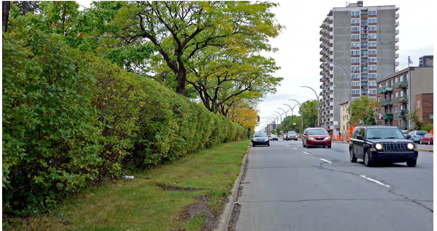
La clôture du boulevard de l'Acadie (dissimulée ici en arrière d'une haie) a été érigée au début des années 1960 quand la Ville de Montréal avait élargi la rue en un boulevard comportant six voies.

« Or, si Montréal était disposé à refaire le boulevard de l'Acadie en quelque chose de plus vert, un boulevard d'un aspect plus résidentiel, et ce faisant nous aurions moins de bruit, moins de vitesse et de circulation, alors il n'y aurait aucune raison pour une clôture ».