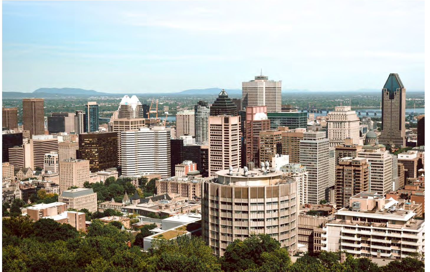
La ville de Montréal pris de haut.

En ajout à ce travail en amont. Le travail en aval du service de police de la ville de Montréal permet aussi de sécuriser la ville. À cet effet, le SPVM a annoncé lundi dernier avoir épinglé 14 suspects et saisi une quinzaine d'armes à feu au cours de cinq opérations distinctes en quatre jours. Dans une déclaration aux médias lundi, l'inspecteur David Shane, porte-parole du SPVM, a rappelé