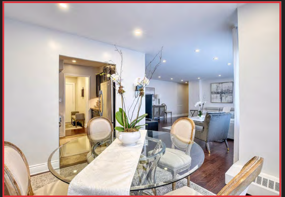
75 GLENGARRY #304

Condo clé en main! Vous apprécierez la qualité des rénovations et la paix d'esprit que cette unité vous procurera. Tout a été pensé pour l'ultime confort et un quotidien sans tracas. Unité bien aménagée avec de vastes espaces de vie pour agrémenter vos réceptions et 2 CAC & 2 salles de bain isolées à l'arrière pour une belle intimité.