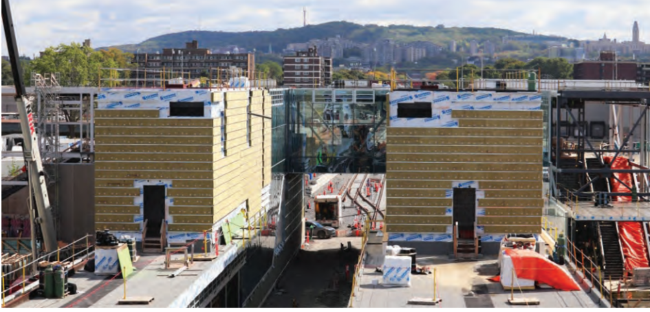
La station Côte-de-Liesse en bonne voie!