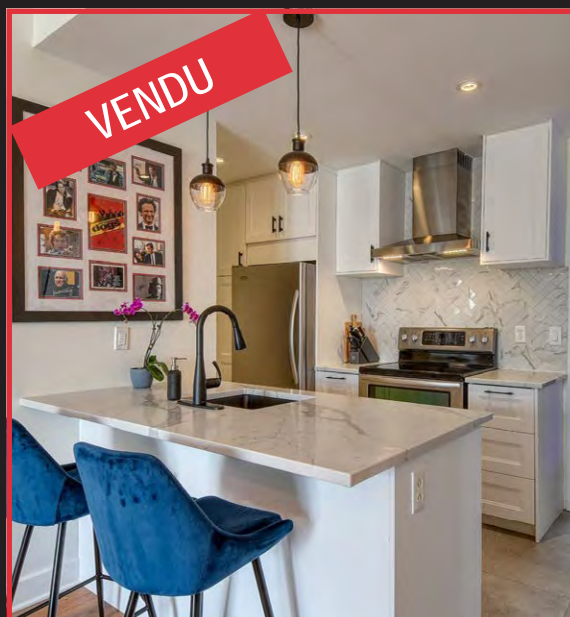
7059 DUROCHER #401