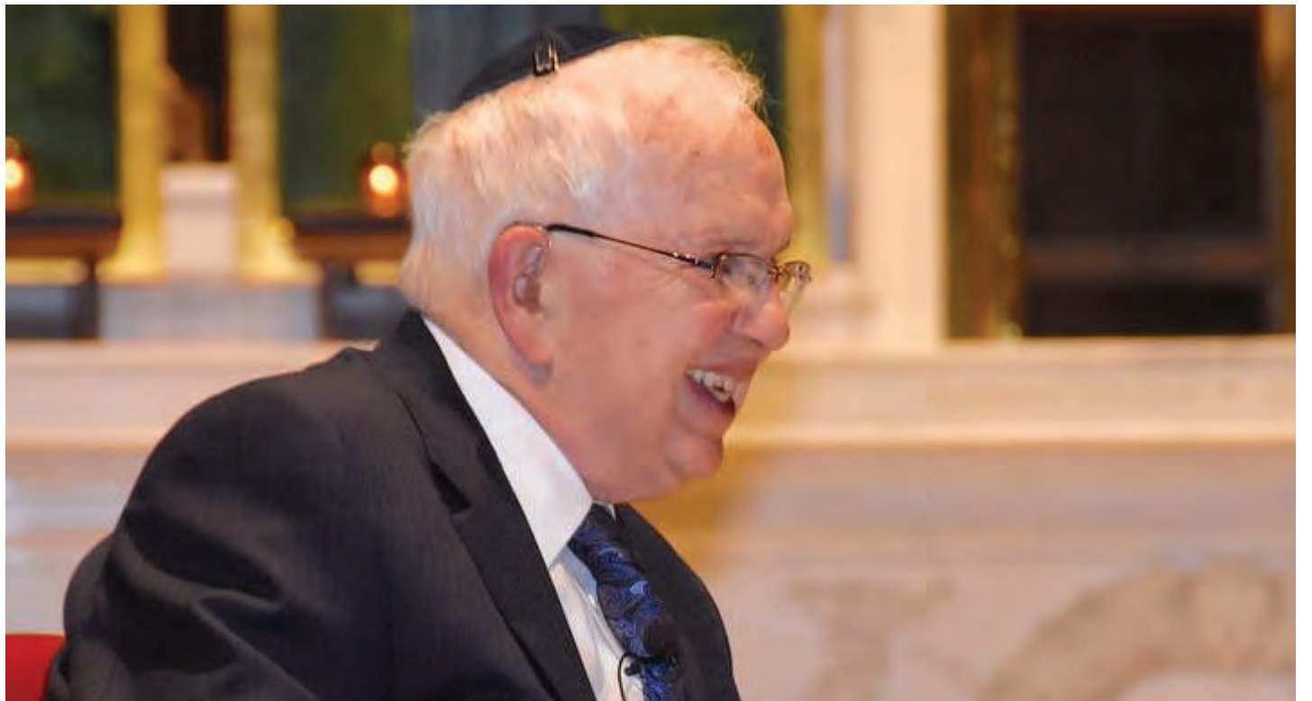
The Rabbi Harold Kushner, circa 2015.

A minister tells of a family, long considered "the very pillars of the church", in which father, mother, and all of the children were active in church organizations, giving sacrificially of their time, money and leadership. One day the daughter was killed in a car accident when returning from a church conference and the family has never been inside a church since