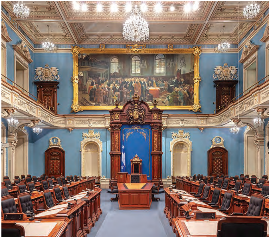
Le salon bleu de l'Assemblée nationale du Québec

Pour atteindre leur objectif, le gouvernement du Québec a mis en place une série de stratégies. Effectivement, à compter de septembre 2022, les élèves inscrits à la technique d'éducation à l'enfance seront admissibles aux bourses Perspective Québec. À noter que les élèves doivent avoir complété un certain nombre de