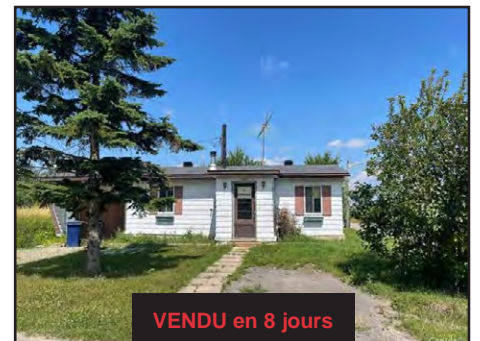
VENDU en 8 jours

Bâtiment de 1956 entretenu avec soins avec les années. Les logements sont actuellement libres, vous y trouverez un 6 ½ de même qu'un 3 ½. Terrain aménagé avec intimité (haie mature) avec piscine creusée, terrasse et remise. PRIX DEMANDÉ 549,900$