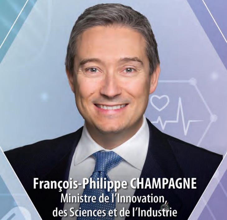
François-Philippe CHAMPAGNE Ministre de l'Innovation, des Sciences et de l'Industrie