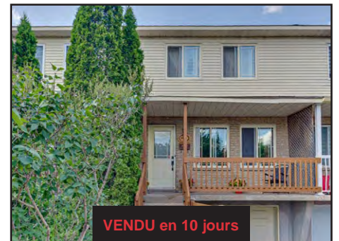
VENDU en 10 jours

Maison sur rue sans issue, 2 CAC avec poss. d'une 3e à l'étage, cuisine rénovée + immense îlot, bardeaux de toit récents, spa et gazébo inclus. Sous-sol de pleine grandeur offrant un immense potentiel. PRIX DEMANDÉ 330,000$