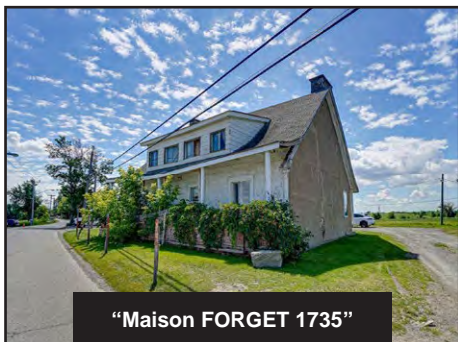
“Maison FORGET 1735”