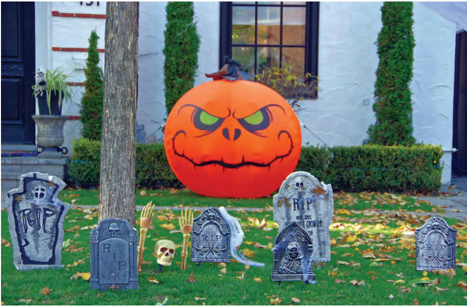
Some of the spooky front-lawn decor placed on their front lawn by some Halloween-spirited town residents.