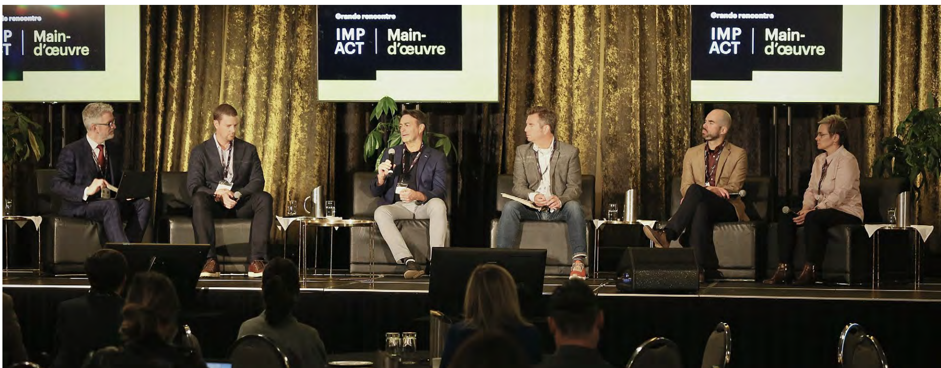
Quelques-uns des panélistes discutant des priorités de Laval dans le cadre de la Grande rencontre IMPACT – Main-d'œuvre lors du panel sur la mobilité et le développement urbain.

Près de 300 acteurs de la communauté d'affaires lavalloise se sont rassemblés à l'occasion de la Grande rencontre IMPACT – Main-d'œuvre aujourd'hui, ce qui permet à la Ville de Laval de franchir le dernier jalon, pour ainsi jeter les bases de la toute première stratégie lavalloise sur la main-d'œuvre. En effet, les réflexions et les informations partagées serviront à mettre en place des solutions innovantes et durables pour soutenir les entreprises dans la crise de la pénurie de main-d'œuvre.