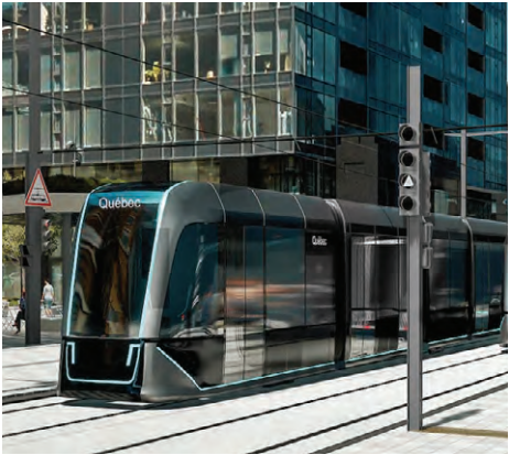
Une des multiples possibilités de wagons pour le tramway de Québec, selon Alstom.