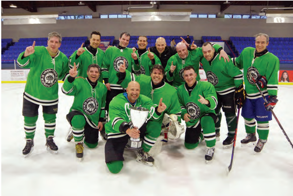
The TMR Executive Hockey League's 2022-2023 season Dawson Cup winners, the Stars, are seen here at ice-level on Sunday April 23 after defeating the Senators in a 4 – 1 match.