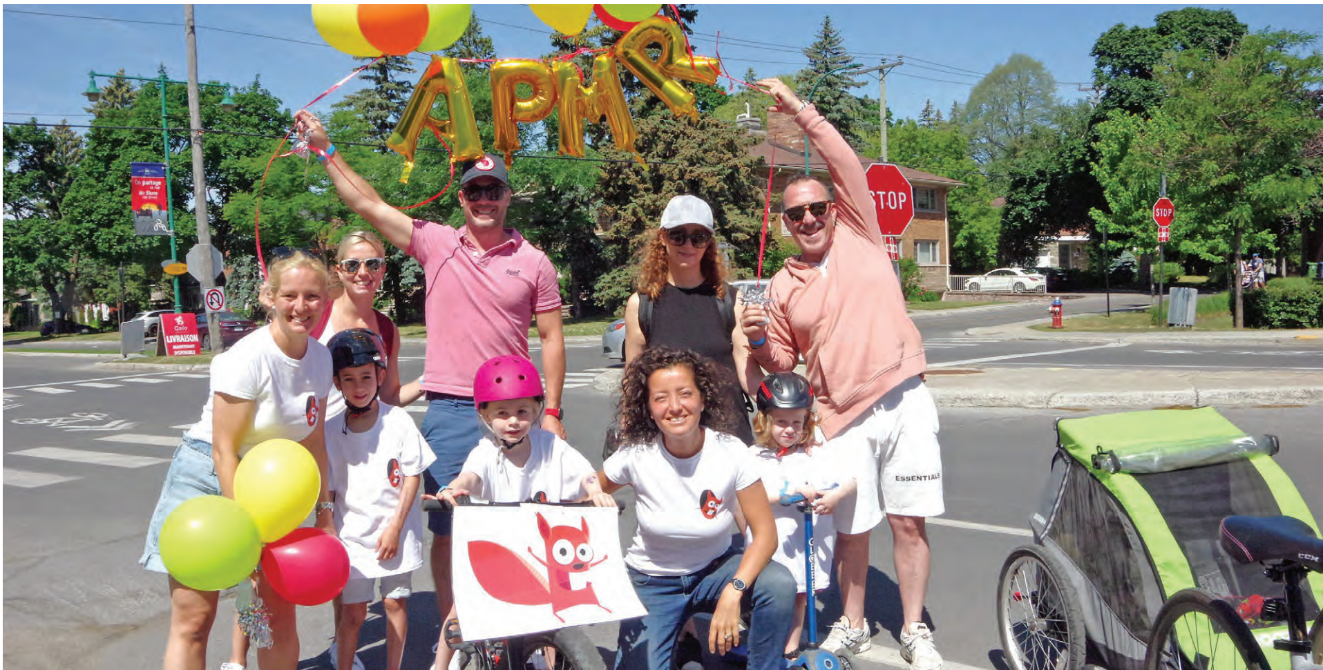
Sous un soleil brillant devant la bibliothèque municipale en juin 2021, on peut voir des dirigeants et des membres de l'APMR au début de la toute première édition du Rallye 2021.