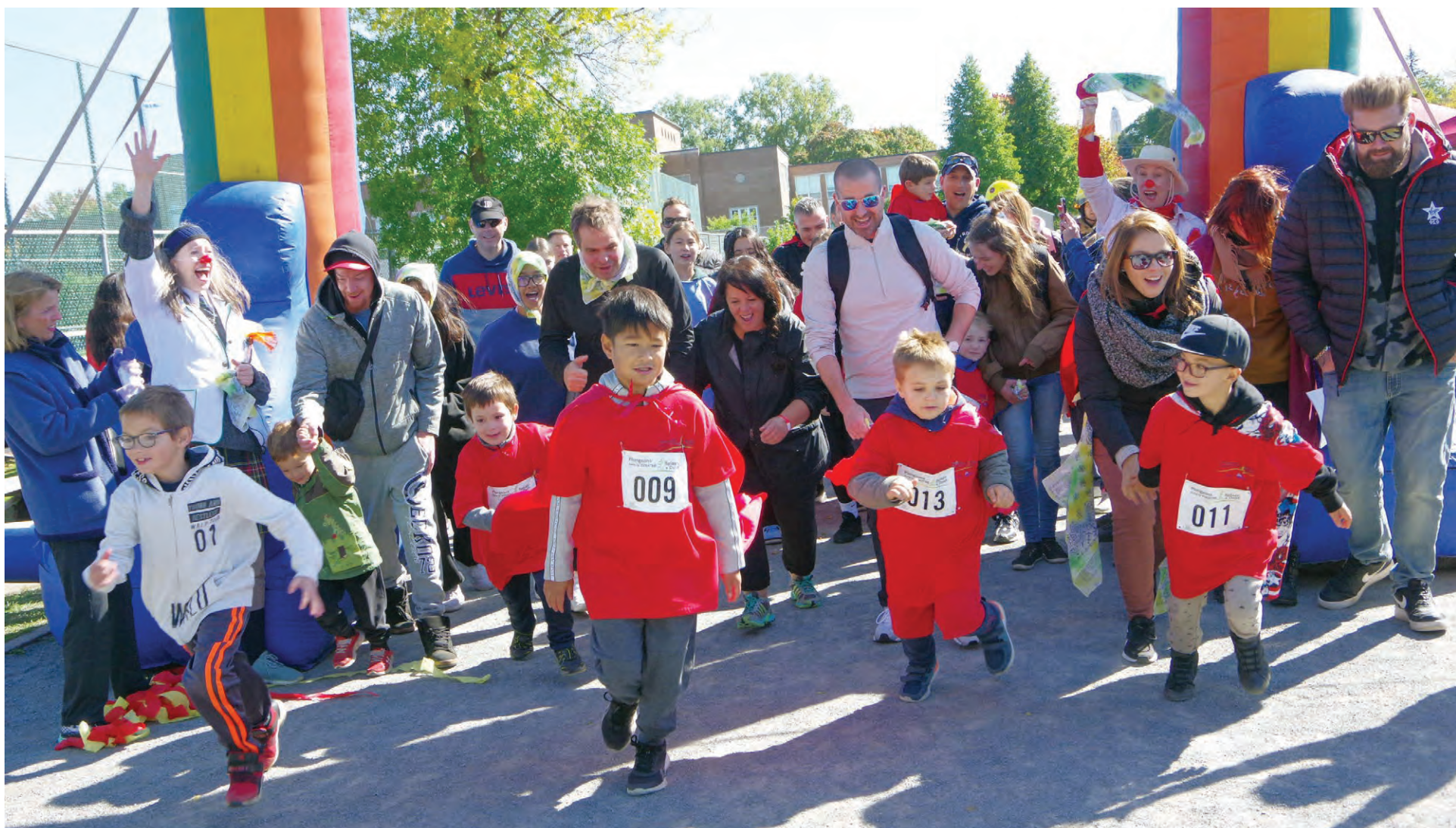
De jeunes coureurs et leurs parents qui participaient au début de l'événement Flâmons dans la course l'an dernier au parc Danyluk de VMR.