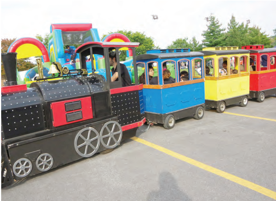
Balades autour du stationnement en petit train au parc Danyluk au cours de la Foire multiculturelle samedi dernier.