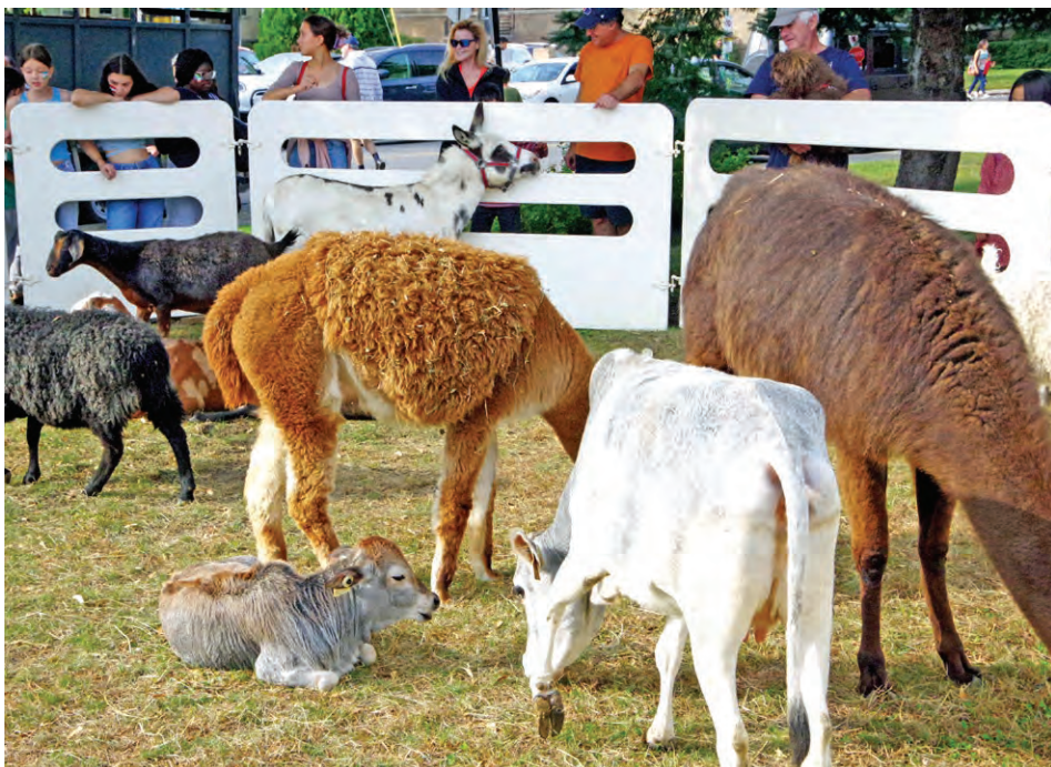
Parmi les activités au cours de la Foire multiculturelle samedi dernier, les jeunes pouvaient caresser les animaux domestiques dans un zoo pour enfants.