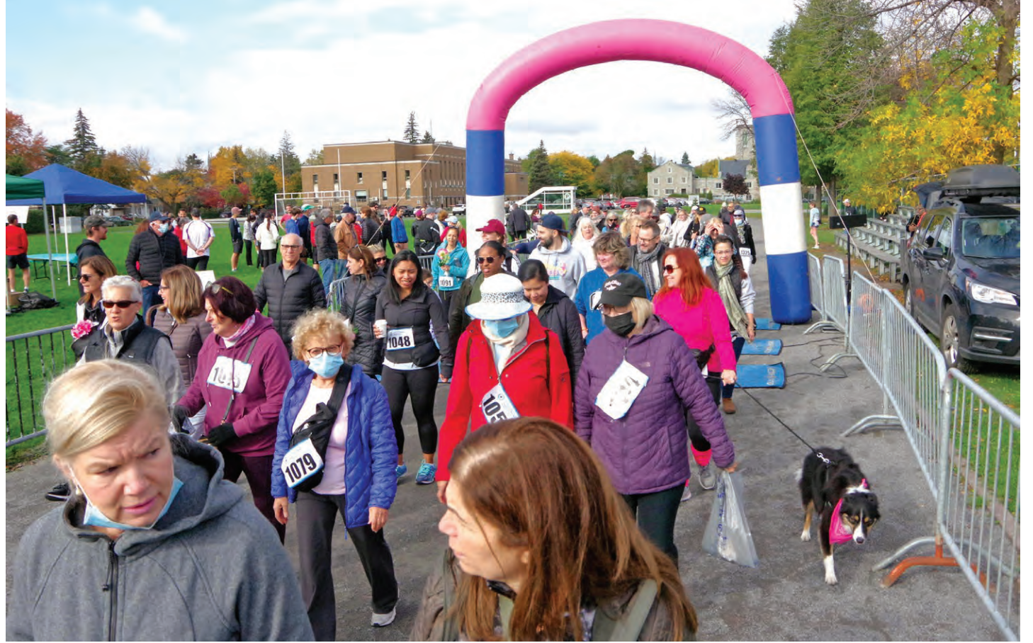
La ligne de départ pour l'événement de la Course contre le cancer de l'ovaire des Cèdres au parc Danyluk à VMR en octobre 2021. L'événement 2023 a lieu ce dimanche dès 8 h 30.

Le projet DOVEEgene repousse les limites du dépistage grâce à un nouveau test Pap