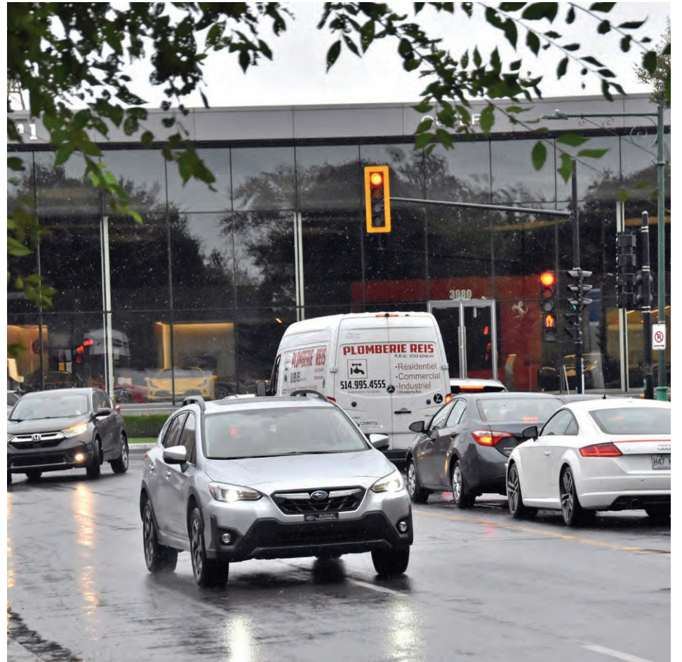
Mayor Peter Malouf has pledged to re-examine traffic and other issues on Lucerne Rd., taking into account a resident's complaint that it is being used by some customers of nearby luxury car dealerships to test drive high-end cars.

Au cours de la séance du conseil municipal de VMR du 19 septembre, le maire Peter Malouf s'est engagé à enquêter des enjeux entourant la circulation sur le chemin Lucerne, à la suite d'une plainte d'un résident que certains conducteurs utilisent cette longue rue pour faire l'essai routier de voitures de sport.