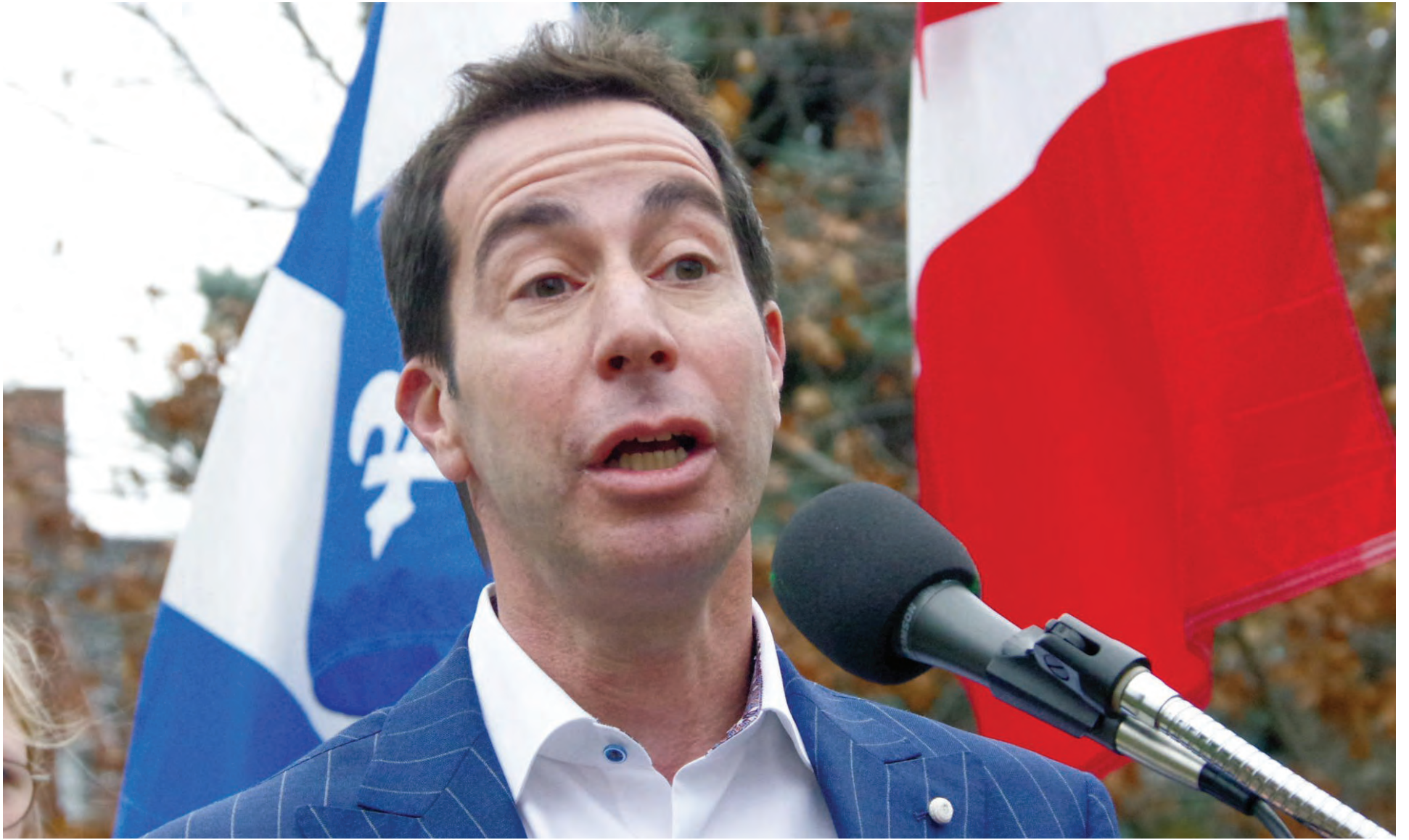
Mount Royal Liberal MP Anthony Housefather is among six members of the Liberal Jewish Caucus who issued a statement earlier this week in the aftermath of the Hamas attack against Israel last weekend.