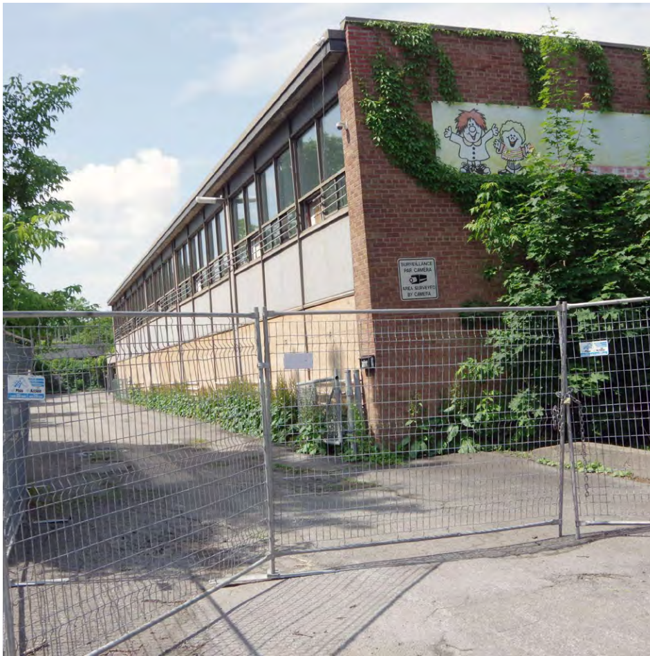
The former Congregation Beth El building on Lucerne Rd. has been abandoned and boarded over while its owner, property developer SAJO Inc., is gradually revising plans to convert the property into a new residential project.