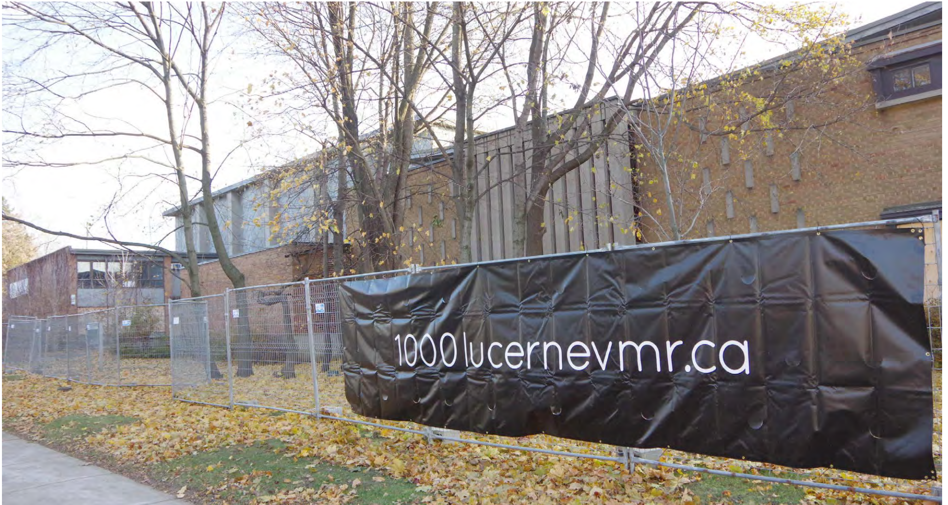
Although the former Congregation Beth-El synagogue campus on Lucerne Rd. is currently abandoned and boarded up, new owner SAJO is promoting a development project for the site.