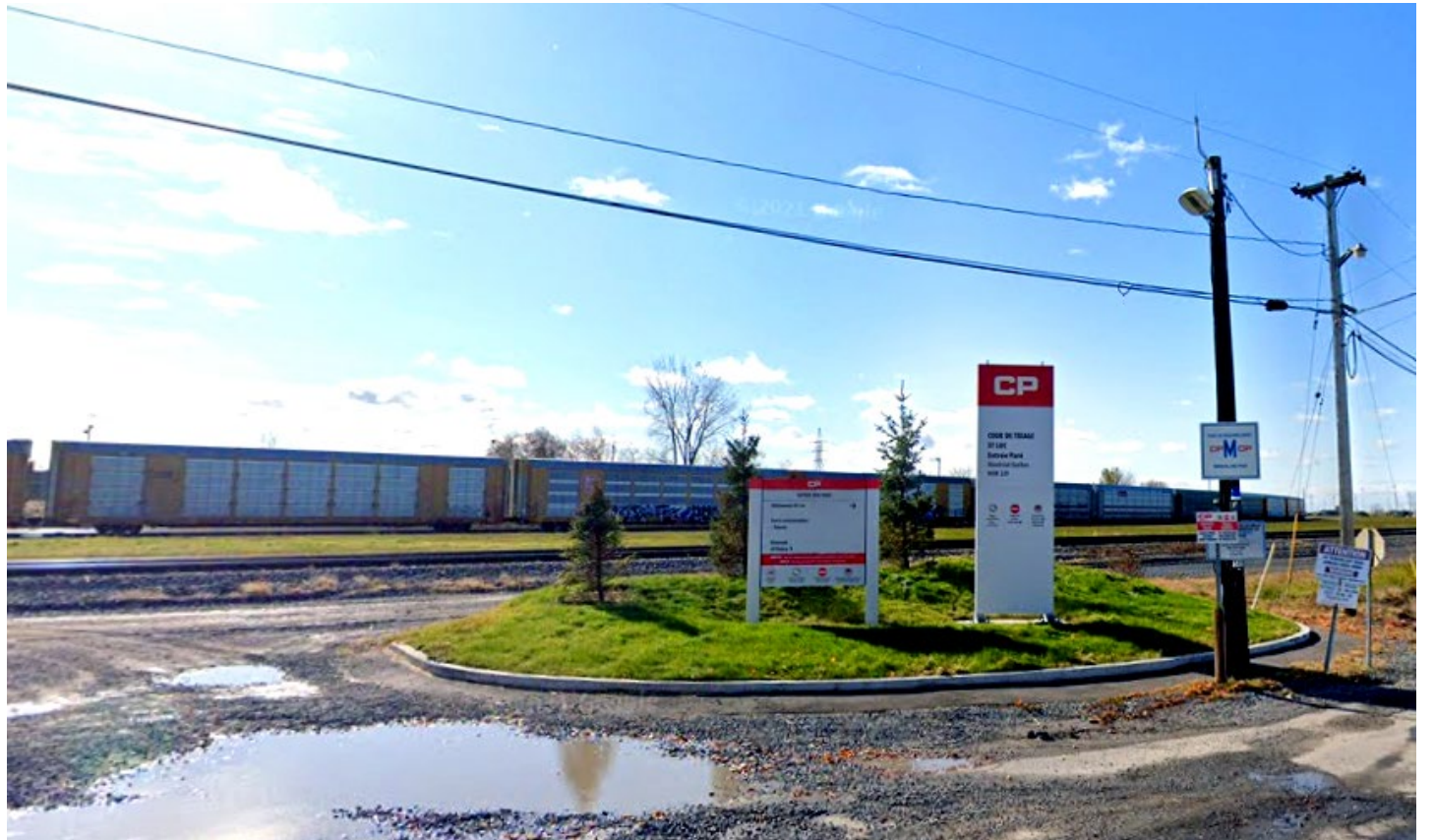
If Mayor Peter Malouf's plan to open CN/CP's private road through the Côte St. Luc rail yard, truck traffic that ordinarily passes along the Decarie Expressway would be spared a lot of time ordinarily spent in traffic.

During a meeting held in December at Montreal city hall by the Montreal Island mayors who lead the Agglomeration Council, Mayor Malouf