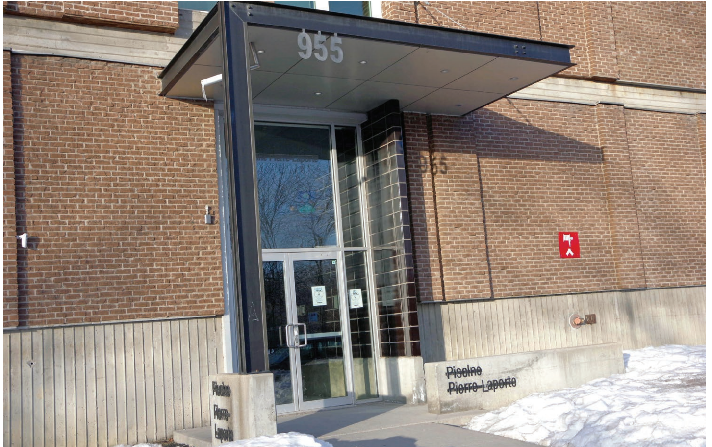
TMR residents won't have access to the École secondaire Pierre-Laporte indoor swimming pool for 18 months starting in June because of repairs to be carried out there by the Centre de services scolaire Marguerite-Bourgeoys.

“As soon as we can have confirmation on options for our residents, we will be advising you,” he added. “This situation proves once again the importance of having our own infrastructure and not relying on an outside partner.”